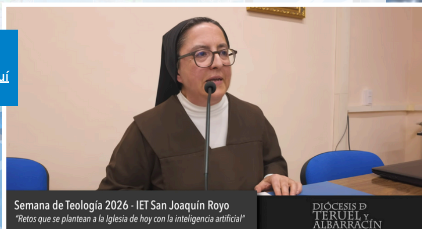
Semana de Teología 2026 - IET San Joaquín Royo "Retos que se plantean a la Iglesia de hoy con la inteligencia artificial"