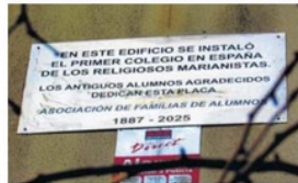
La placa instalada en la calle Marina número 5, esquina San Martín.